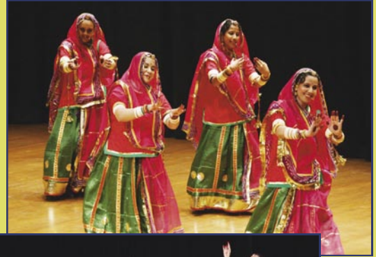
صورة لفرقة راجستاني للرقص الشعبي