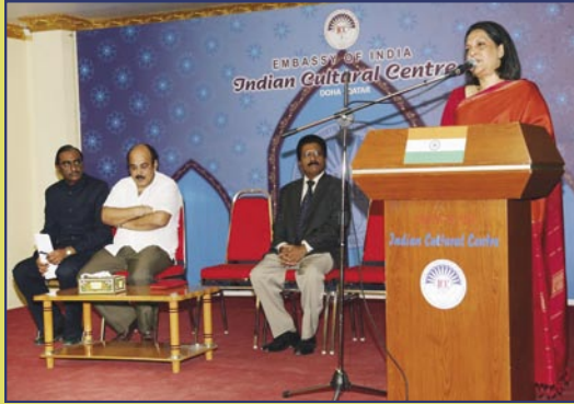
سعادة السفيرة/ ديبا جوبالان تتحدث في حفل الاستقبال الذي تم تنظيمه للترحيب بالسادة الفنانين.

قامت سفارة الهند بتنظيم احتفالية ثقافية هندية بالتعاون مع وزارة الثقافة والفنون والتراث في دولة قطر كجزء من احتفالية "الدوحة عاصمة للثقافة العربية ٢٠١٠". افتتح المهرجان كل من وزير الثقافة والفنون والتراث القطري معالي/ د. حمد بن عبد العزيز الكواري ومعالي سفيرة الهند لدولة قطر ديبا جوبالان. وبهذه المناسبة، قامت ثلاث مجموعات ثقافية هي (فرقة راجستاني للرقص الشعبي بقيادة راجماتا جوفيردان وادهاوا، وفرقة قواري بقيادة الإخوة نظامي، وفرقة كاثاك للرقص بقيادة د. ريكا ميهر) بتقديم استعراضات رائعة حازت على إعجاب الحاضرين. وقد أقيمت هذه الاحتفالية على المسرح الوطني القطري في الفترة ٢٦-٢٨ سبتمبر ٢٠١٠. كما تم تنظيم احتفالية سينمائية هندية وعرض ثلاثة أفلام هي: Refugee و Khakee و Lakhya بسينما لاندمارك، إضافة إلى حفل استقبال بالمركز الثقافي الهندي في ٢٥ سبتمبر ٢٠١٠ لتقديم الفنانين المشاركين في الاحتفالية إلى الجالية الهندية بقطر ورجال الصحافة.