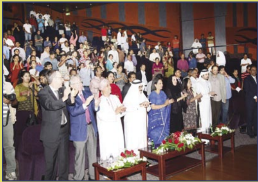
تصفيق حار من جانب سعادة السفيرة والجمهور لفرقة كاثاك للرقص