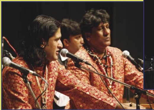
فرقة أخوة نظامي في حفلة لموسيقى القوالي