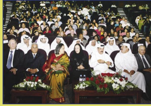
معالي وزير الثقافة وحرمة بصحبة سعادة السفيرة يشاهدان العرض الذي تقدمه فرقة راجستاني للرقص الشعبي خلال يوم الافتتاح.